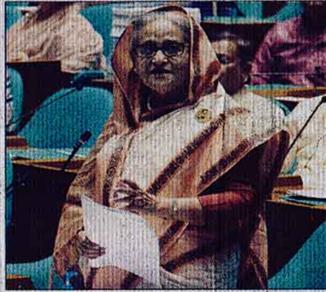
গতকাল জাতীয় সংসদে দ্বাদশ জাতীয় সংসদের তৃতীয় অধিবেশনে সমাপনী ভাষণ দেন প্রধানমন্ত্রী সংসদ নেতা শেখ হাসিনা

ওই সেল গ্রহণযোগ্য তথ্যাদি প্রাপ্তির পর একটি প্রকল্প প্রস্তাব প্রণয়ন করবে। আশা করা যায় ২০৩৫ সালের মধ্যে দেশে পরীক্ষামূলকভাবে হাইড্রোজেন