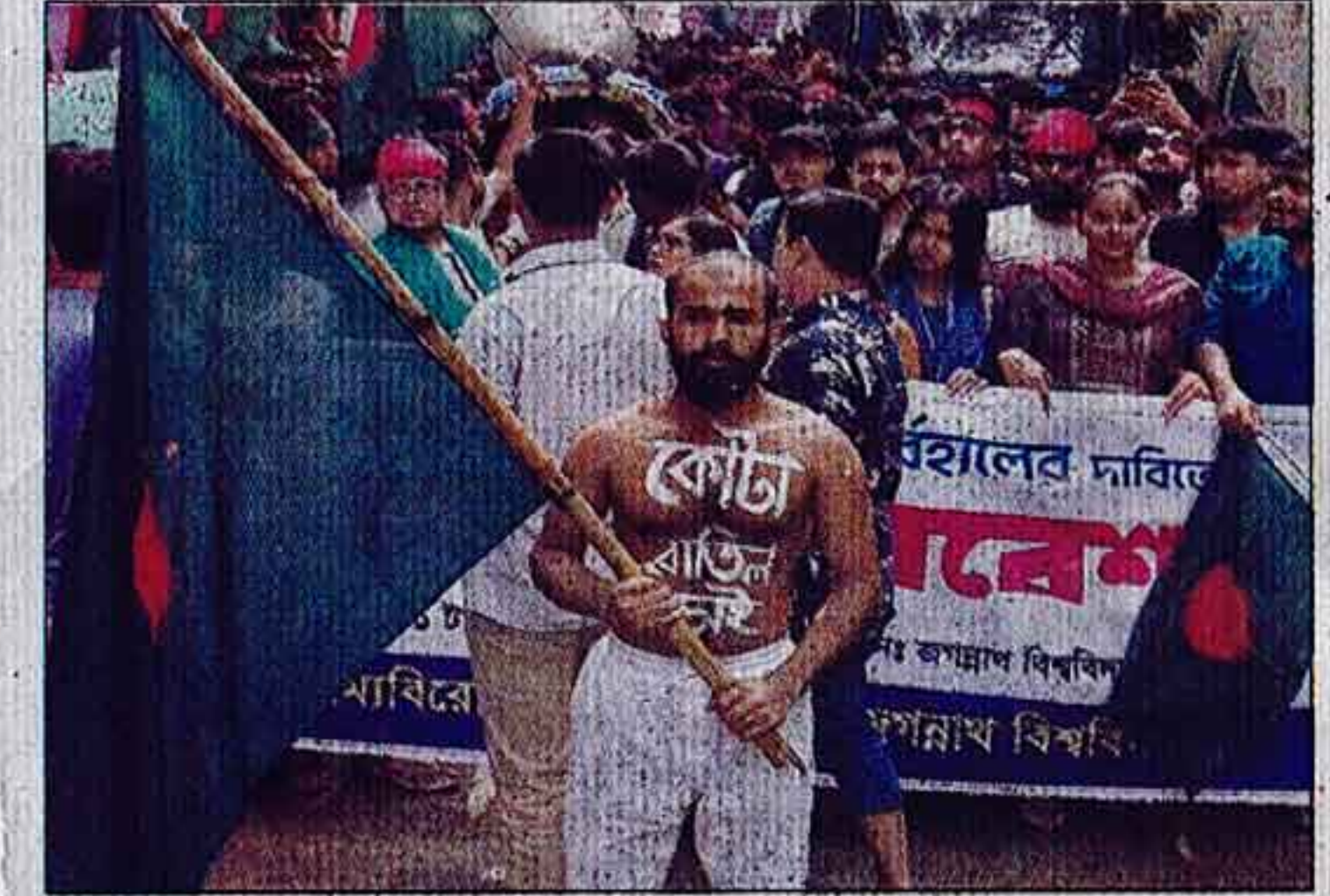
কোটা বাতিলের পরিপত্র বহাল রাখার দাবিতে গতকাল আন্দোলন করেন জগন্নাথ বিশ্ববিদ্যালয়ের শিক্ষার্থীরা